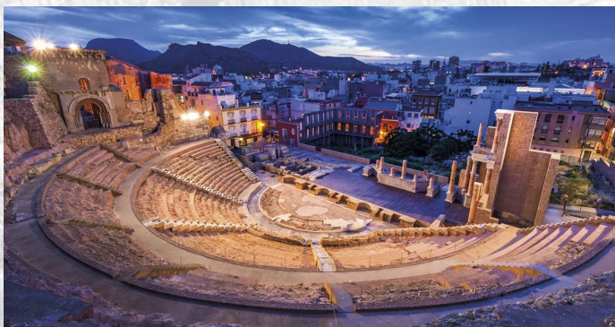
Teatro Romano de Cartagena