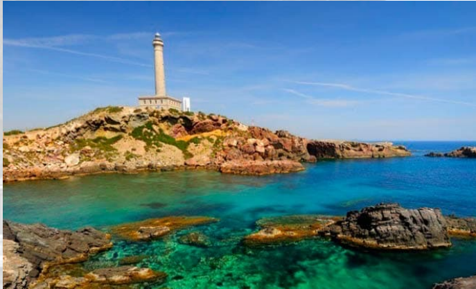
Faro de Cabo de Palos