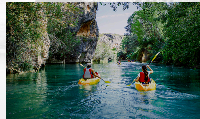
Rafting en el Río Segura