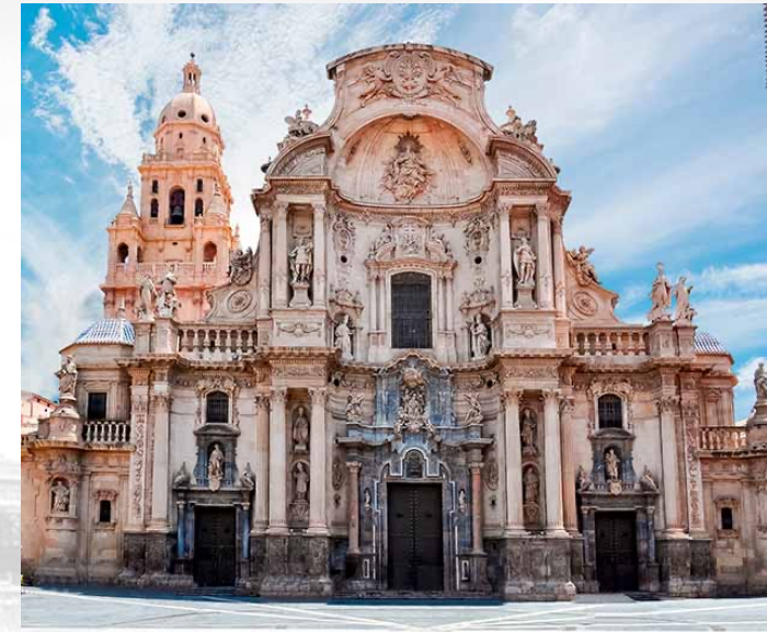
Catedral de Murcia